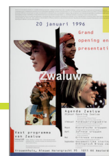
Ontwerp: Shohaila Najand (Collectie IAV-Atria).

Affiche voor de officiële opening van Zwaluw op 20 januari 1996.