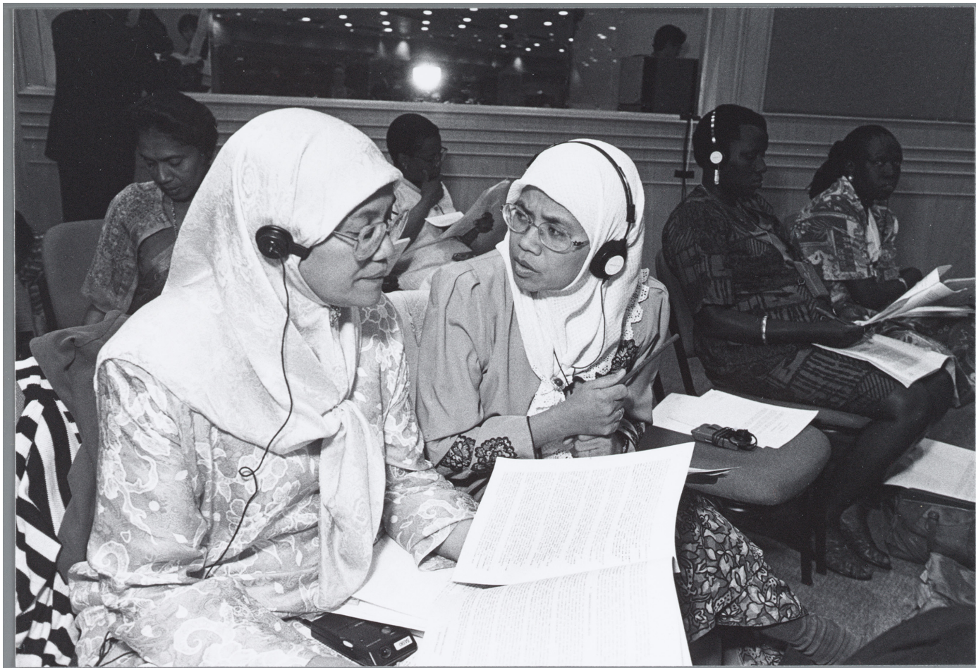
Deelnemers aan de Wereldvrouwenconferentie Beijing, 1995.

De ZMV-Vrouwen organiseren zich niet alleen in Nederland, maar ook internationaal. In 1995 bundelen ze hun krachten om aanwezig te zijn bij de vierde Wereldvrouwenconferentie van de Verenigde Naties in Beijing.