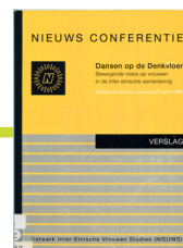
Voorkant programma 'Dansen op de Denkvloer', 26 en 27 april 1996.