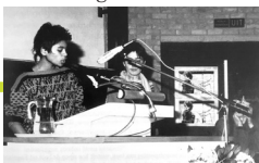
Uit publicatie: "Vrouwen van Nijmegen. Twintig Jaar in Beweging", De Feeks, 2000.