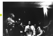
Foto: Bertien van Manen (Collectie IAV-Atria). Presentatie eerste uitgave Ashanti, sept. 1980.