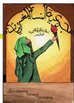
Affiche: Ontwerper onbekend. Affiche van de Marokkaanse Vrouwenvereniging, 1982.

De MVVN focust zich op de rechtspositie en zichtbaarheid van Marokkaanse migrantenvrouwen. De MVVN wordt opgericht door Marokkaanse vrouwen die het oneens waren met het feit dat het Steunkomitee Marokkaanse Vrouwen (1977) door autochtone Nederlanders werd geleid.