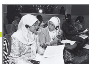
Deelnemers tijdens de VN-Wereldvrouwenconferentie in Beijing, 1995.