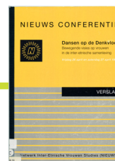
Collectie IAV-Atria. Voorkant programma 'Dansen op de Denkvloer', 26 en 27 april 1996.

De conferentie 'Dansen op de Denkvloer' is een belangrijk moment van uitwisseling en kennisvorming voor ZMV-Vrouwen uit verschillende domeinen. Lokale initiatieven, kunstenaars en wetenschappers komen samen. De bijeenkomst wordt georganiseerd door het Netwerk voor Inter-Etnische Vrouwenstudies (NIEUWS).