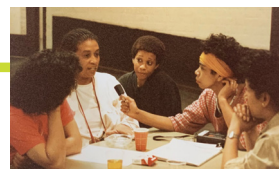
Landelijke Zwarte Vrouwendag, 1986.