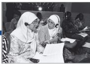
Deelnemers tijdens de VN-Wereldvrouwenconferentie in Beijing, 1995.