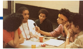
Landelijke Zwarte Vrouwendag, 1986.

Molukse vrouwen richten de landelijke vrouwenorganisatie Kelompok op. Enkele Molukse vrouwen verzamelen zich al vanaf 1952 in de christelijke Federatie Kaum Ibu Protestan Maluku di Belanda.