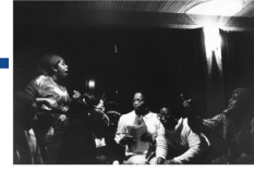
Presentatie eerste uitgave Ashanti, sept. 1980.

Ashanti is een marxistisch blad voor en door Surinaamse vrouwen. Er worden veel thema's besproken, van abortus tot onderwijsprojecten of lesbische relaties tussen zwarte vrouwen. De laatste uitgave verscheen in 1987.