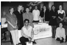
Foto: Amazone Nativel (Collectie IAV-Atria). Medewerkers E-Quality.

E-Quality is het eerste kennis- en expertisecentrum voor gender én etniciteit. Maatschappelijke kwesties worden niet alleen vanuit de witte norm maar ook vanuit een ZMV-perspectief belicht. E-Quality is in 2012 opgegaan in het huidige kennisinstituut Atria.