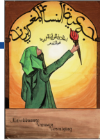
Affiche: Ontwerper onbekend (Collectie IAV-Atria). Affiche van de Marokkaanse Vrouwenvereniging, 1982.