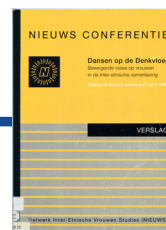
Voorkant programma 'Dansen op de Denkvloer', 26 en 27 april 1996.

De conferentie 'Dansen op de Denkvloer' is een belangrijk moment van uitwisseling en kennisvorming voor ZMV-Vrouwen uit verschillende domeinen. Lokale initiatieven, kunstenaars en wetenschappers komen samen. De bijeenkomst wordt georganiseerd door het Netwerk voor Inter-Etnische Vrouwenstudies (NIEUWS).