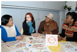
Plaatselijke netwerkcoördinatoren van Tiye International, 2005.

Tiye International is een overkoepelende organisatie van 21 Nederlandse ZMV-Vrouwenorganisaties. Tiye strijdt nog steeds op wereldwijd niveau om gelijke kansen voor ZMV-Vrouwen en gelijke rechten voor mannen en vrouwen te realiseren.