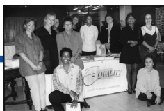
Foto: Amazone Nativel (Collectie IAV-Atria). Medewerkers E-Quality.

E-Quality is het eerste kennis- en expertisecentrum voor gender én etniciteit. Maatschappelijke kwesties worden niet alleen vanuit de witte norm maar ook vanuit een ZMV-perspectief belicht. E-Quality is in 2012 opgegaan in het huidige kennisinstituut Atria.