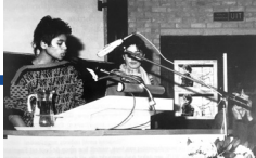
Uit publicatie: "Vrouwen van Nijmegen. Twintig Jaar in Beweging", De Feeks, 2000.