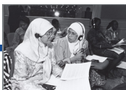
Deelnemers tijdens de VN-Wereldvrouwenconferentie in Beijing, 1995.