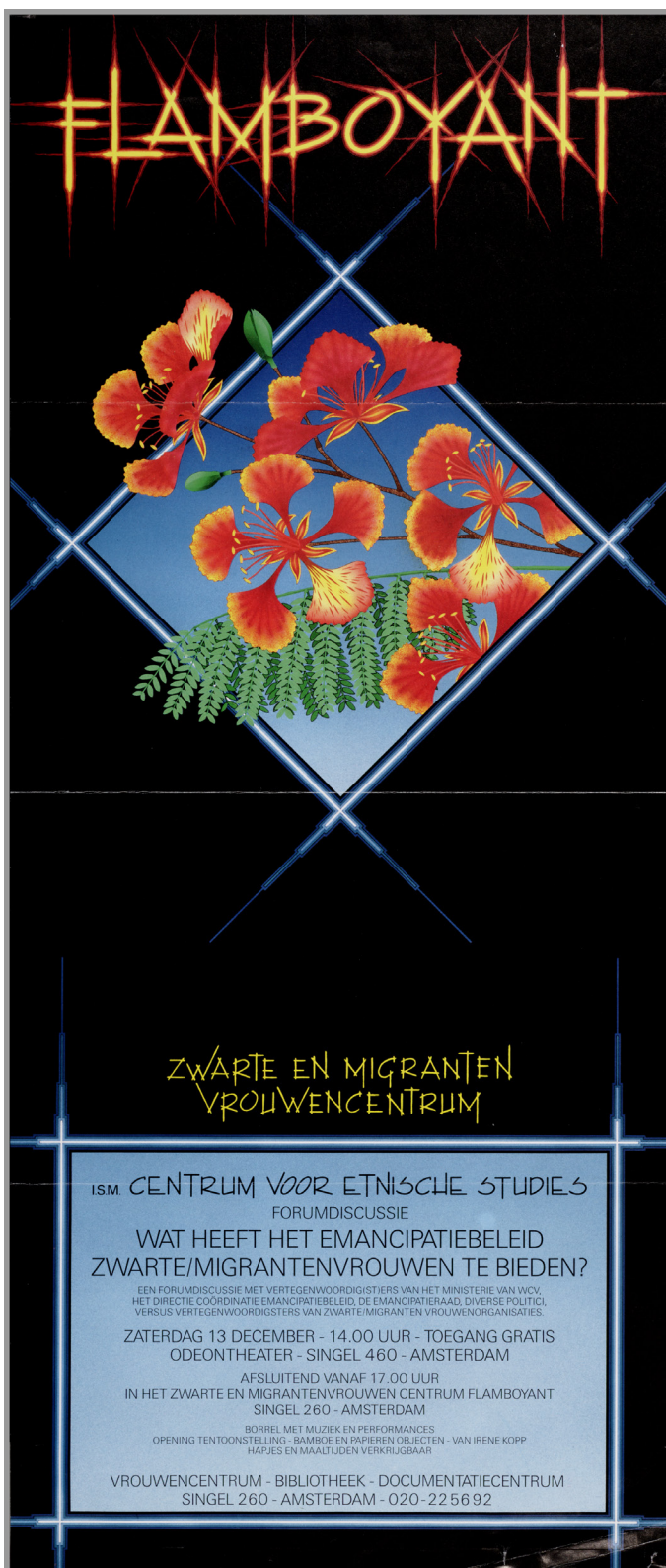
BRON 3 Stichting Flamboyant (Collectie IAV-Atria). Affiche Flamboyant, 1986.

Flamboyant, het Landelijke Zwarte en Migranten Vrouwencentrum, Bibliotheek en Archief is tussen 1986 en 1990 actief in Amsterdam. Het is een ontmoetingsplaats en documentatiecentrum voor ZMV-Vrouwen. In 1991 moet Flamboyant de deuren sluiten vanwege een subsidiestop. Een groep vrouwen van Flamboyant richt een jaar later de organisatie ZAMI op, een nieuw ontmoetingscentrum voor ZMV-Vrouwen.