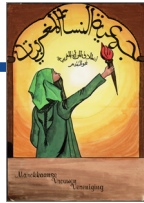
Affiche: Ontwerper onbekend. Affiche van de Marokkaanse Vrouwenvereniging, 1982.

De MVVN focust zich op de rechtspositie en zichtbaarheid van Marokkaanse migrantenvrouwen. De MVVN wordt opgericht door Marokkaanse vrouwen die het oneens waren met het feit dat het Steunkomitee Marokkaanse Vrouwen (1977) door autochtone Nederlanders werd geleid.