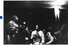
Presentatie eerste uitgave Ashanti, sept. 1980.