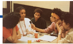
Landelijke Zwarte Vrouwendag, 1986.