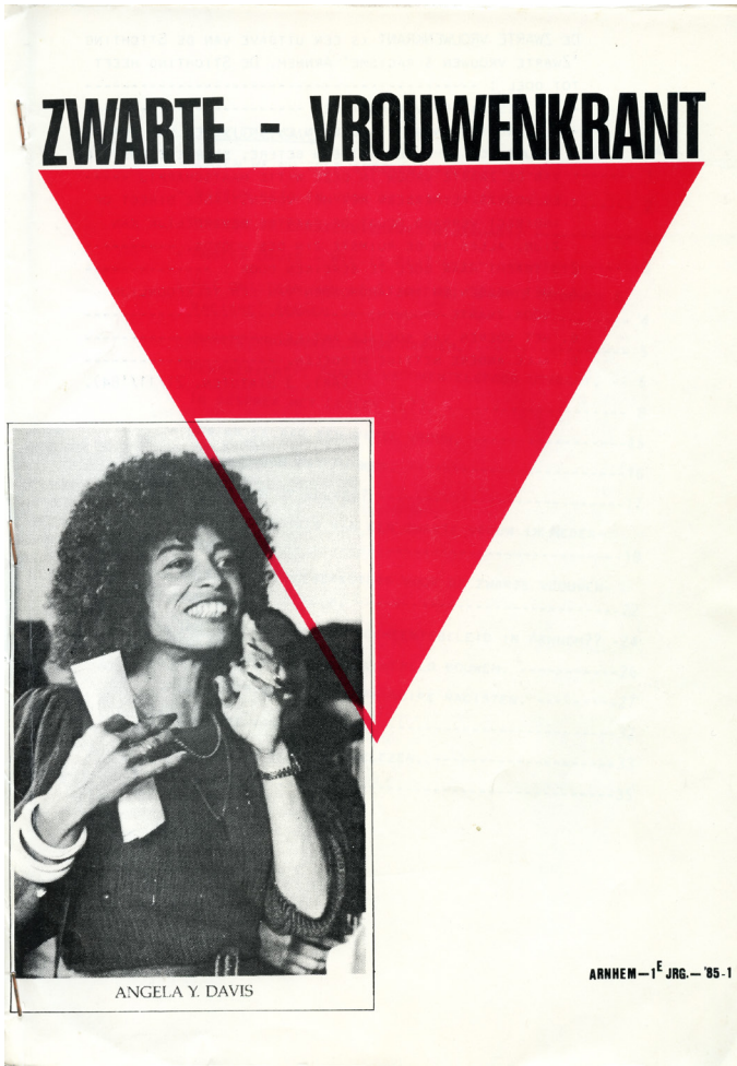
BRON 4 Voorkant van de Zwarte Vrouwenkrant, 1985 (Collectie IAV-Atria).