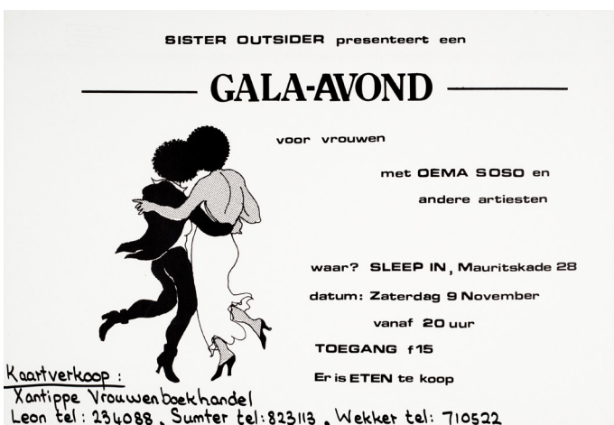
BRON 10 Affiche voor gala-avond voor vrouwen, georganiseerd door Sister Outsider, 1985.