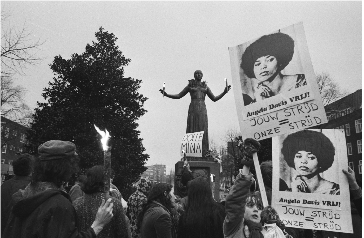
BRON 1 Dolle Mina viert haar eenjarig bestaan in Amsterdam voor het Wilhelmina Druckermonument, 30 januari 1971, Rob Mieremet (Anefo / Nationaal Archief).