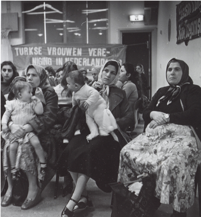
BRON 6 Bijeenkomst van Hollanda Türkiyeli Kadınlar Birliği in een buurthuis in Amsterdam, 8 maart 1982, Anne Vaillant (Collectie IAV-Atria).