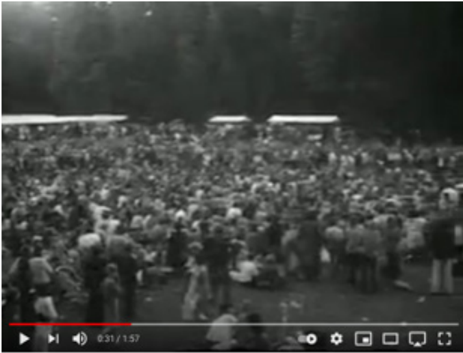
BRON 8 Tweede Vrouwenfestival in het Vondelpark in Amsterdam, 1977.