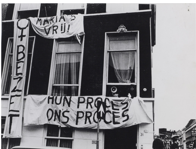
BRON 11 Dolle Mina bezet de Portugese ambassade uit protest tegen het terechtstaan van de drie Maria's, 1974.