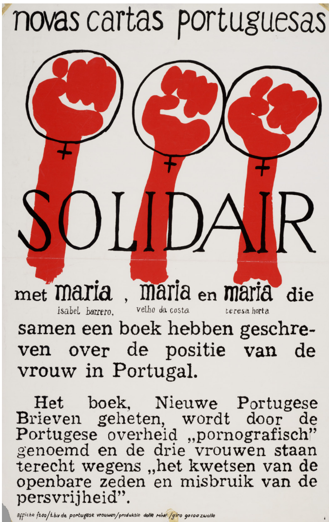
BRON 10 Affiche voor oproep tot steun van de drie Maria's, 1974.