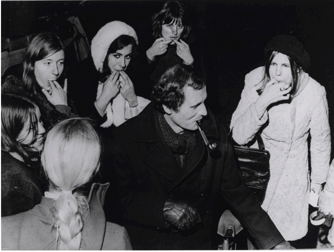
BRON 4 Nafluit-actie van Dolle Mina, ca. 1970, Egbert van Zon (Collectie IAV-Atria).