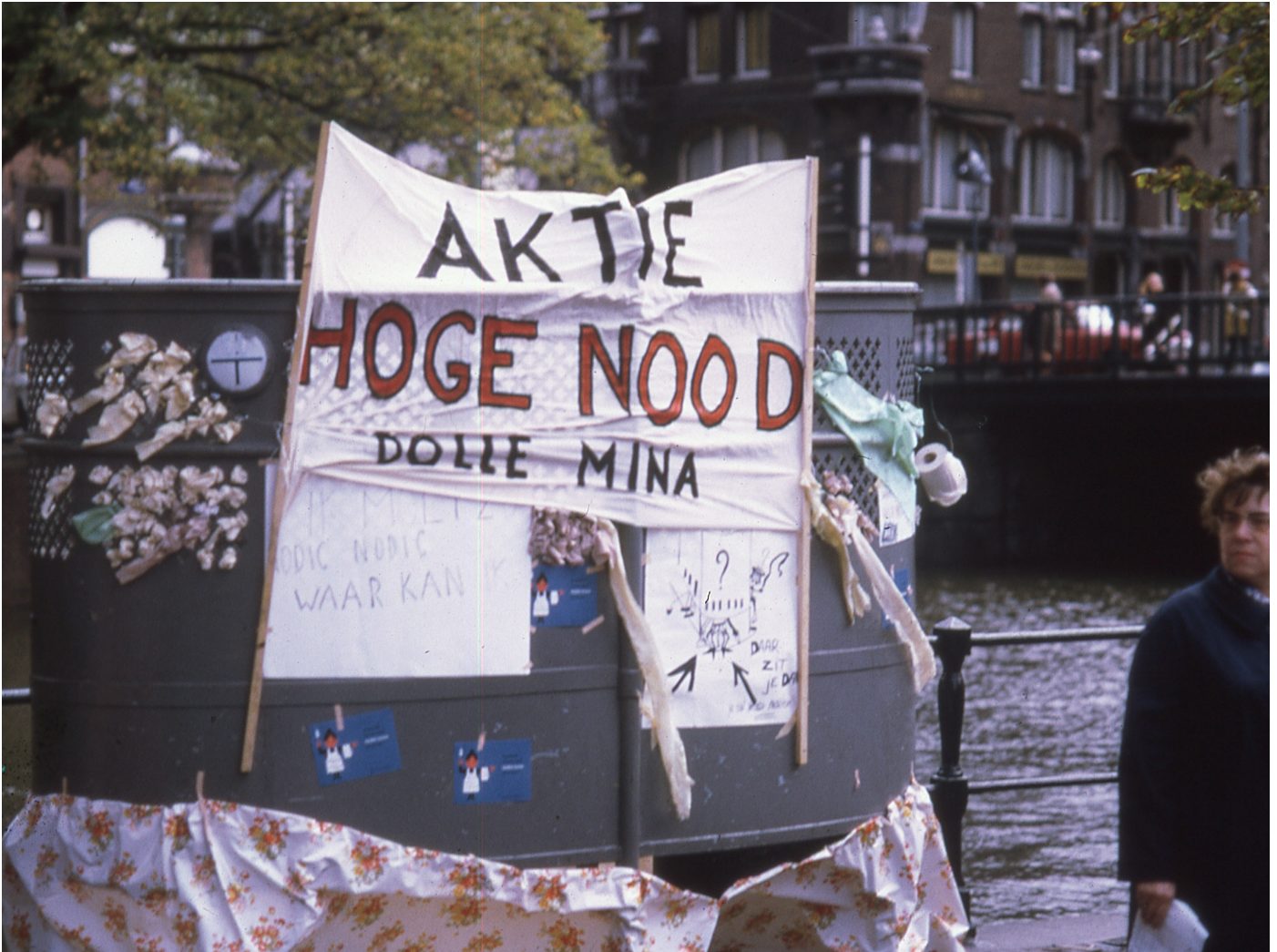
BRON 1 Plasactie door Dolle Mina, vrouwen eisen plasrecht, oktober 1970, Jan Timmer (Collectie IAV-Atria).