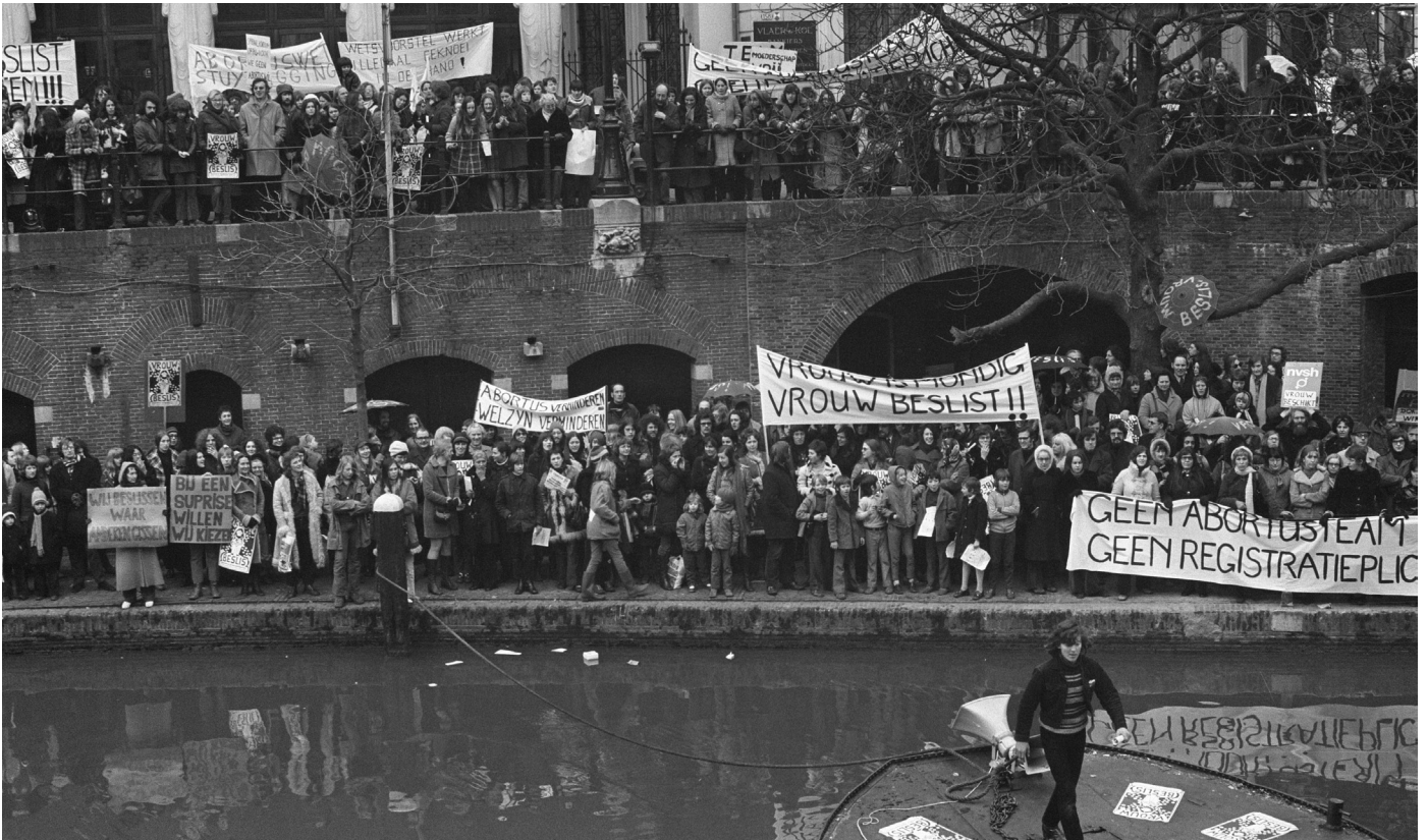
BRON 9 Dolle Mina's protesteren in Utrecht tegen de nieuwe abortuswet, 19 februari 1972, Rob Mieremet (Anefo / Nationaal Archief).