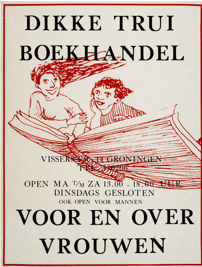
BRON 7 Reclameaffiche voor vrouwenboekhandel Dikke Trui, 1979.