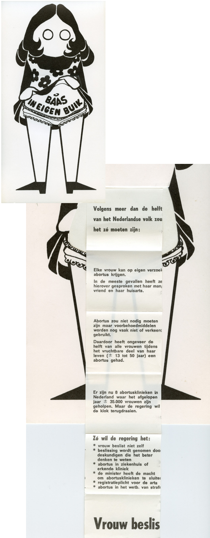
BRON 1 Briefkaart 'Baas in eigen Buik', 1970, Koten.