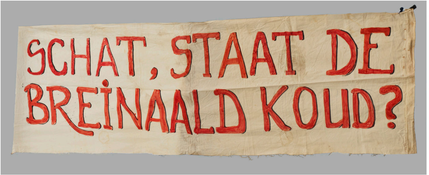
BRON 3 Spandoek 'Schat, staat de breinaald koud?' (Collectie IAV-Atria).