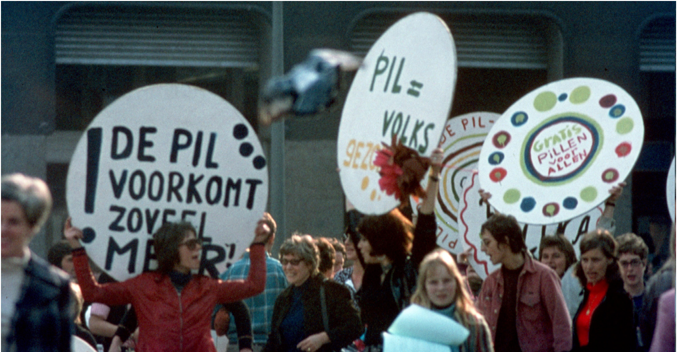
BRON 9 Pil actie van Dolle Mina op de Dam in Amsterdam, oktober 1970, Jan Timmer (Collectie IAV-Atria).