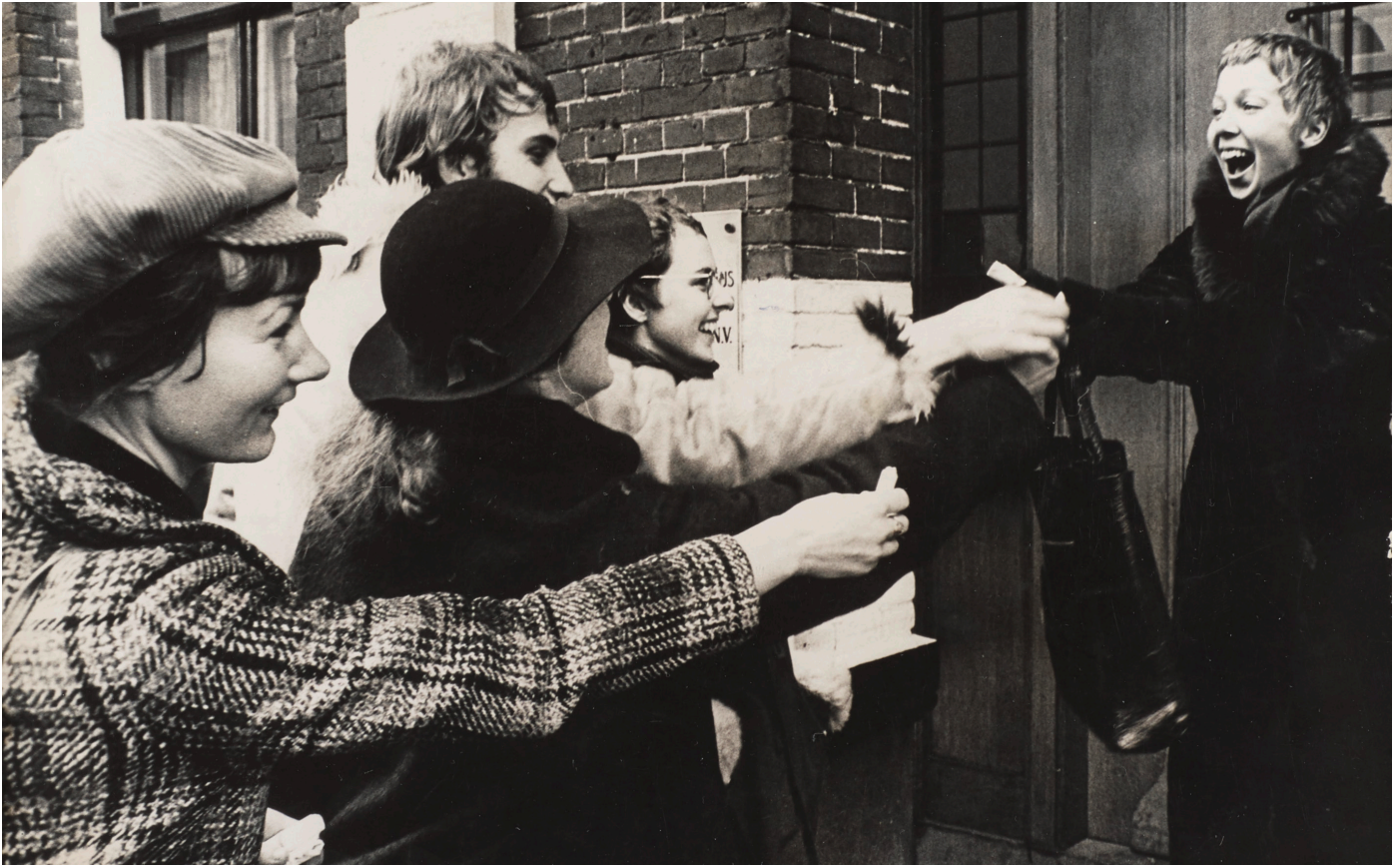
BRON 8 Dolle Mina deelt gratis condooms uit bij secretaresse-opleidingsinstituut Schroevers, 19 februari 1970.