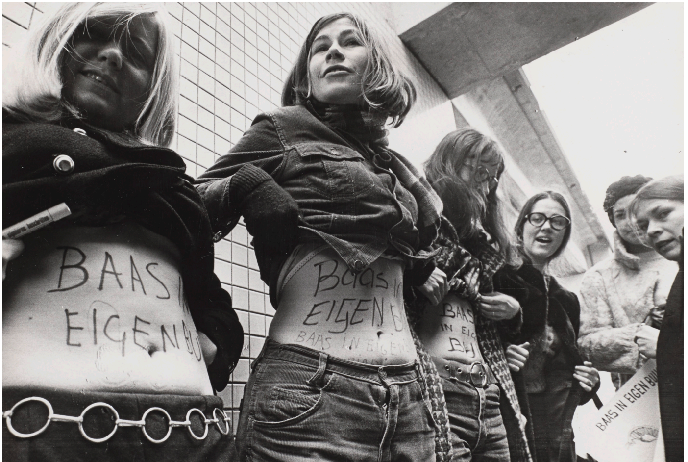
BRON 5 Dolle Mina lanceert tijdens een inval bij een gynaecologencongres in Utrecht de kreet 'Baas in eigen Buik', 14 maart 1970, Jaap Herschel (Spaarnestad Photo / Collectie IAV- Atria).