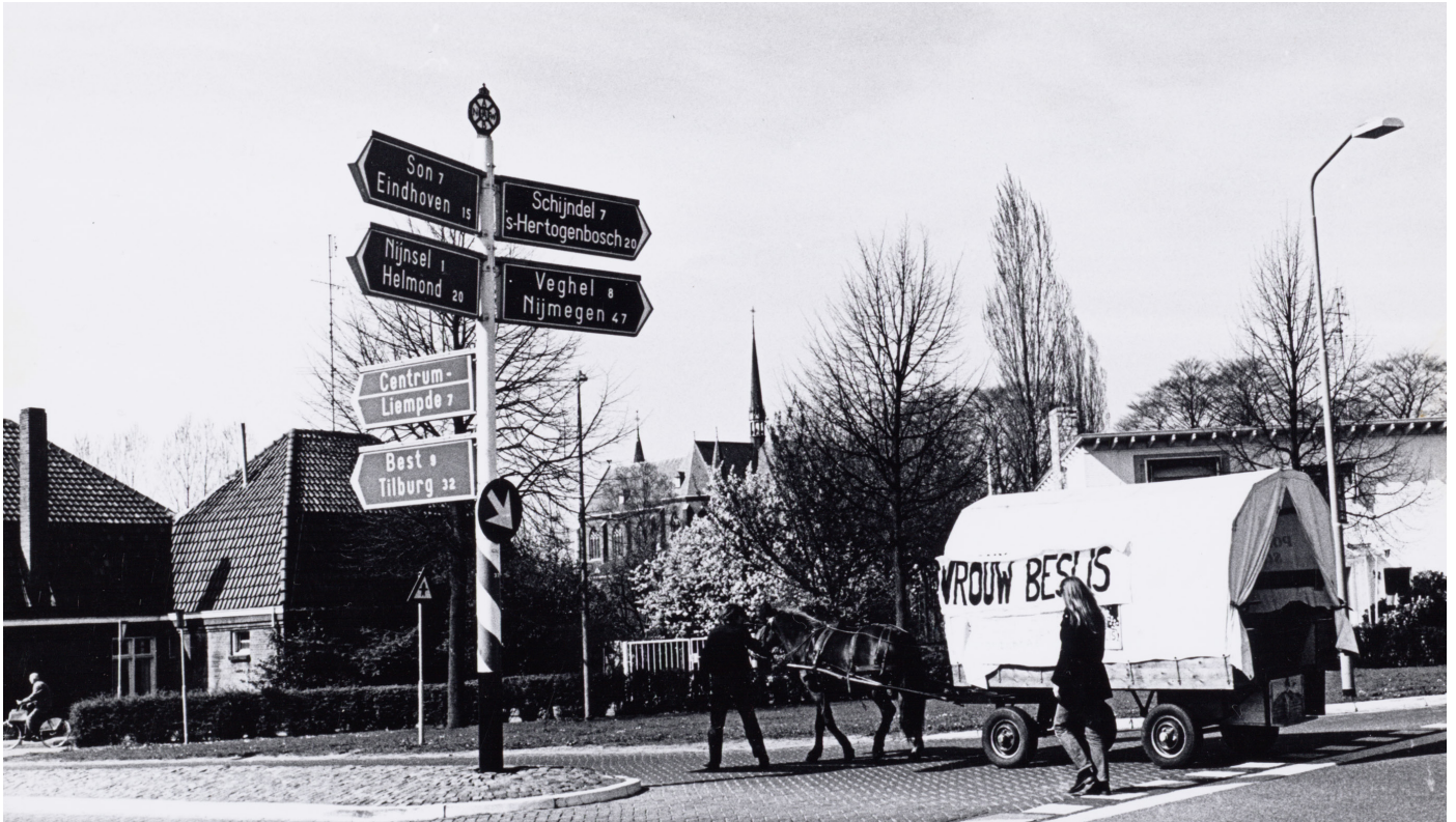
BRON 6 Dolle Mina huifkartocht, 1972, Eva Besnyö (Maria Austria Instituut / Collectie IAV-Atria).